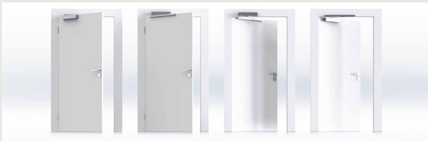
1. Montaggio su lato cerniere