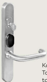
Kaba c-lever, jossa TouchGo ja RFID-toiminto

Järjestelmä vastaa moniin toiveisiin myös turvallisuuden kannalta, sillä TouchGo-toiminnolla varustettu c-lever on integroitavissa olemassa oleviin Kaba -turvallisuusratkaisuihin. Järjestelmäsi säilyy yhtä turvallisena kuin se on ollut tähänkin asti: TouchGo lisää käyttömukavuutta ja takaa parhaan mahdollisen suojan investoinnillesi.