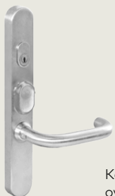
Kaba TouchGo oviyksikkö

Jokaisen lukitusjärjestelmän päätavoitteena on turvallisuus. Kaba TouchGo lisää sekä turvallisuutta että käyttömukavuutta. Hävinnyt kulcutunniste on helposti ohjelmoitavissa pois käytöstä. Näin vältetään turvallisuusriskeiltä ja kalliilta kokonaisten lukitusjärjestelmien vaihtamiselta. Lisäksi Kaba TouchGo tarjoaa aivan uudenlaista käyttömukavuutta, sillä se avaa oven vain niille, jolla on kulkuoikeus, oven pysyessä lukittuna muille.