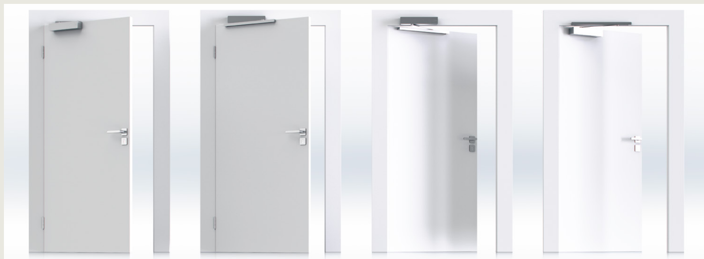
1. Montage sur l'ouvrant côté paumelles