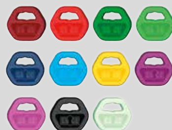
Färbige Schlüsselclips (Miniclips ebenfalls erhältlich)