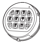
3750-K Clavier rond