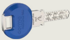
Standardschlüssel mit blauem Clip