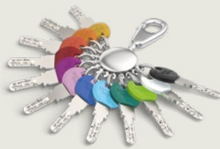
Für den Standardschlüssel gibt es Smartkey-Clips in 12 Farben.