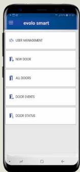
Smartphone per la programmazione