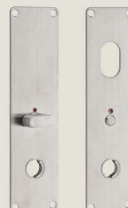
3835 Långskylt med signal

Till rostfritt trycke i 38-serien. Mattborstat rostfritt stål.