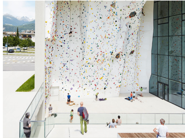
01 Zeitgemäßes und freundliches Industrie-Design prägen die Optik des Kletterzentrums in Bruneck