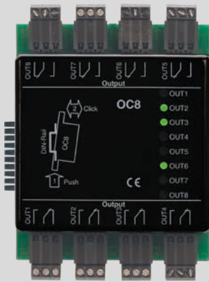
dormakaba Erweiterungsmodul 90 30