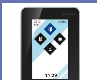
Interfaccia organizzata secondo il corporate design aziendale