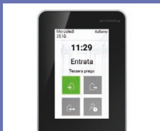
Interfaccia con immagine di sfondo specifica aziendale