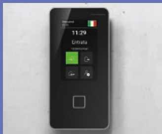
Nuova interfaccia standard (di fabbrica)

Personalizzazioni dell'interfaccia utente del terminale dormakaba 96 00