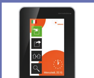
Interfaccia organizzata liberamente con immagine aziendale