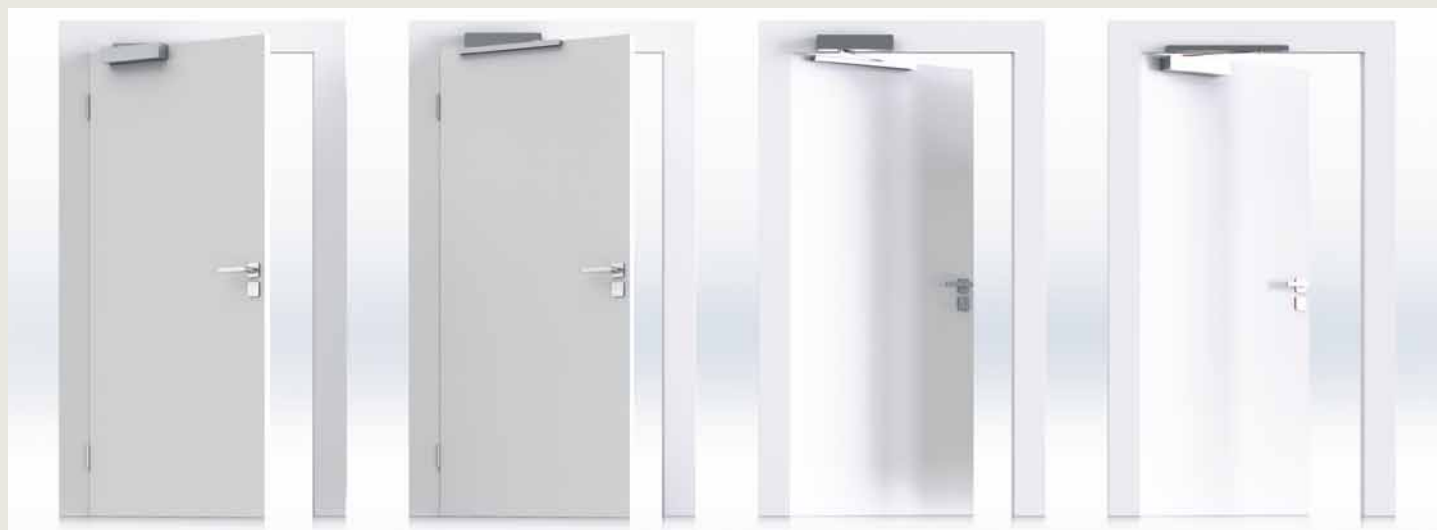
1. Montage sur l'ouvrant côté paumelles