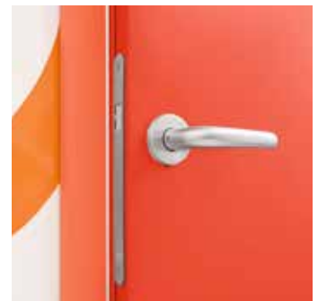
Domoferm-Zarge mit Innentürschloss SOLO/MAF