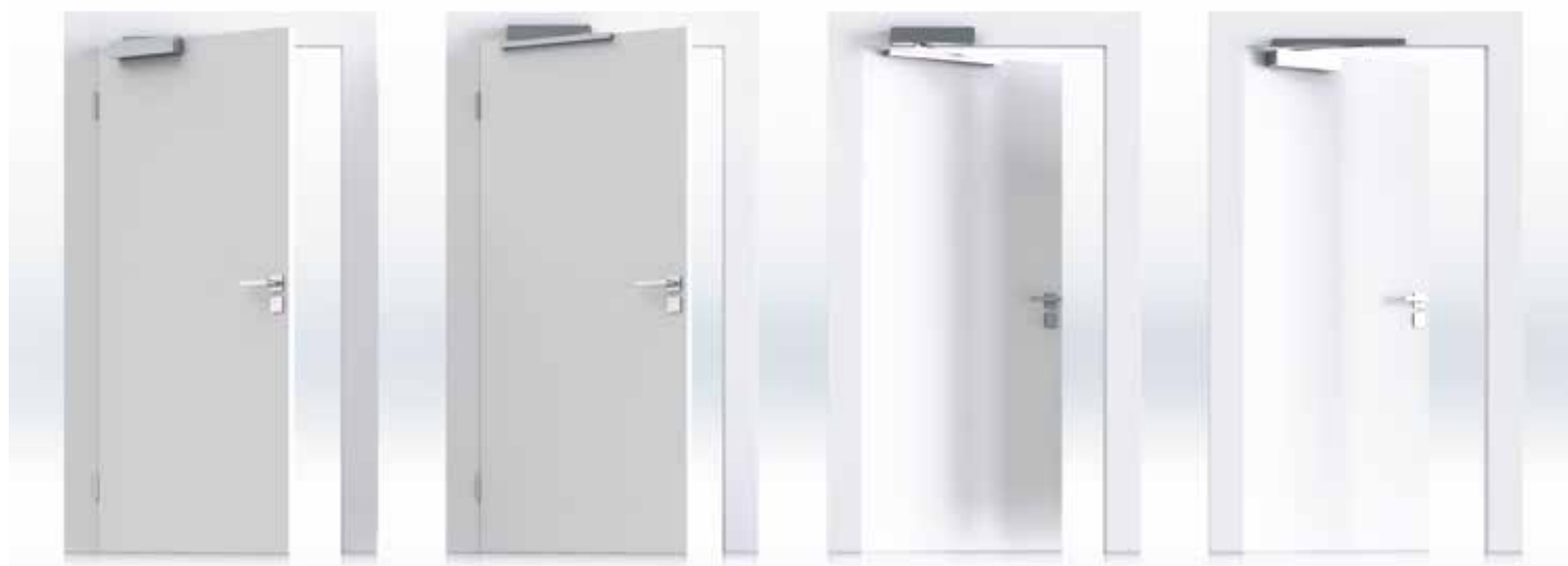
1. Türblattmontage Bandseite