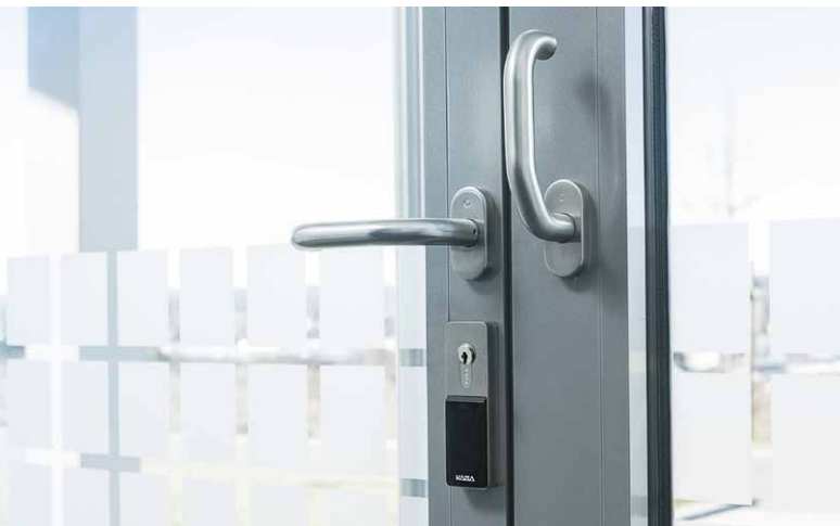
Versión de sobreponer – Módulo electrónico en el lado interior de la puerta