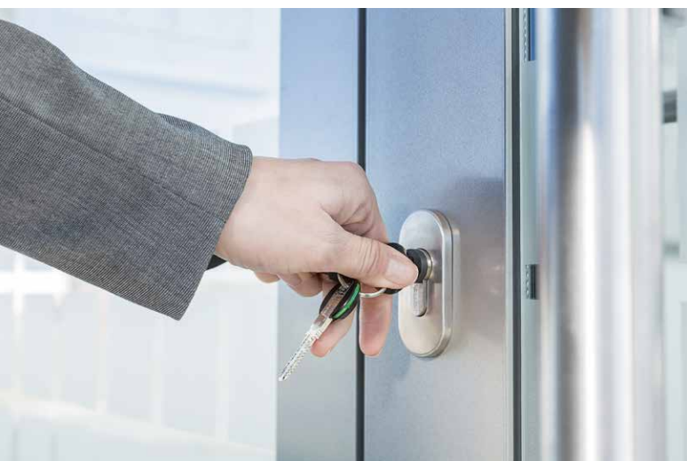
Cilindro mecatrónico – Vista exterior. El módulo electrónico está integrado en la hoja de la puerta en la versión estándar.

El cilindro compacto agrupa en una unidad el cilindro mecatrónico y la electrónica. Los cilindros de cierre existentes se pueden sustituir de forma rápida y sencilla por cilindros mecatrónicos con verificación electrónica de autorizaciones. Desde el interior, la puerta puede abrirse y cerrarse cómodamente utilizando el pomo. Para sustituir la batería se extrae el pomo metálico.