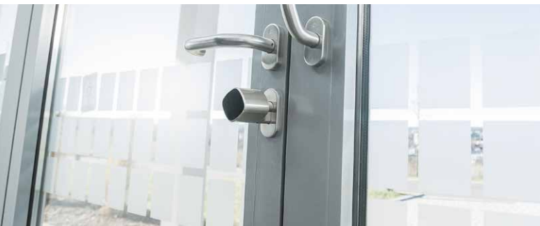
Cilindro compacto – Módulo electrónico en el pomo interior

La versión de sobreponer cautiva por su diseño elegante. Es la solución ideal para puertas de protección contra incendios o de emergencia. Donde quiera que se desee instalar un control de acceso electrónico, se puede utilizar el cilindro mecatrónico, pues no requiere ningún tipo de modificación en la puerta. En esta variante únicamente se fija la robusta carcasa metálica en el cilindro del lado interior de la puerta. Es posible elegir entre el cilindro mecatrónico con pomo giratorio o el cilindro doble. La batería está integrada en la carcasa. La sustitución de la batería se realiza en un instante, retirando la tapa de plástico con la herramienta Multi Tool.