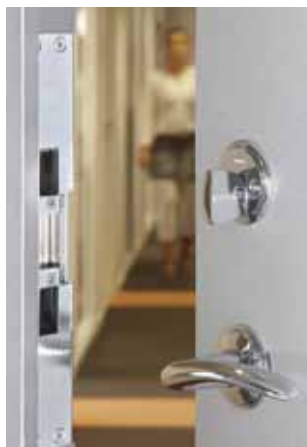
DORMA EM Magnetlås

Elslutbleck i DES 8-serien har en kraftig konstruktion och används framför allt för daglåsning av dörrar i gemensamhetsutrymmen och för kontorsdörrar med hög användarfrekvens.