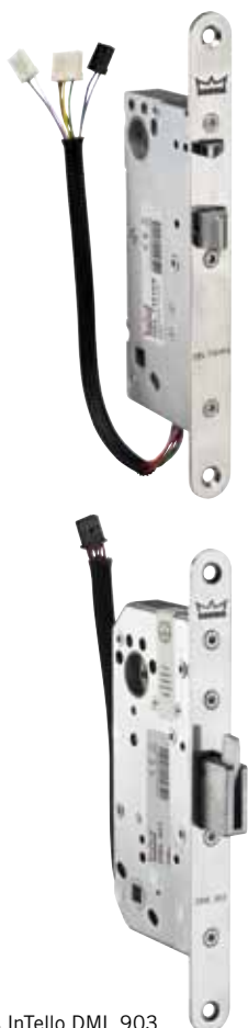
Motorlås InTello DML 903

Med elektrisk låsning ökar du kontrollen på dina dörrlösningar. Vi tillhandahåller olika lösningar för att tillfredsställa just din säkerhetsstandard, allt från mindre kontorsbyggnader till statliga säkerhetsinrättningar.