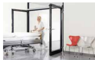
Für schnelle Abläufe 10–11