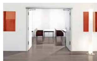
Für den kontrollierten Zutritt 14–15