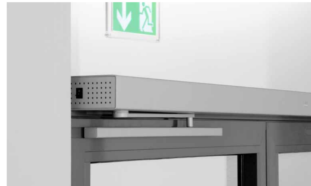
Professional: Nahtlose Verkleidung mit nur 70 mm Ansichtshöhe, für Profiltüren sehr gut geeignet.

Die mechanische Schließfolgeregelung ED ESR für zweiflügelige Türen arbeitet wartungsfrei und sorgt bei Türen mit Falz dafür, dass diese in der richtigen Reihenfolge schließen. Alle Komponenten des ED ESR sind unsichtbar unter der nur 70 mm hohen Abdeckung im DORMA Contur Design integriert.