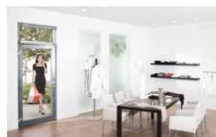
Für barrierefreie Zugänge 8–9