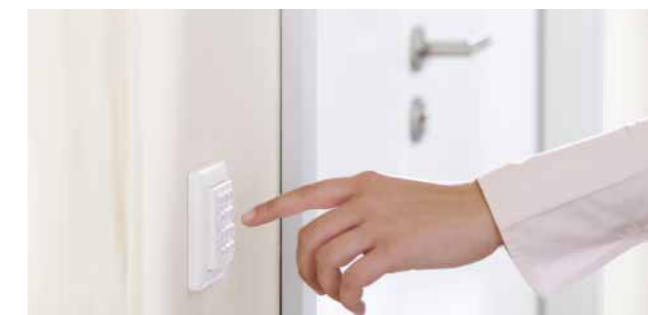
Sichere Zutrittskontrolle und einfache Bedienung: per Tastendruck.

Auch das bidirektionale DORMA BRC-Funksystem kann mit den Drehflügeltürantrieben ED 100 und ED 250 gekoppelt werden. Die Schnittstelle für den Funkempfänger BRC-R ist bereits in den Antrieben vorgesehen und die Installation denkbar einfach. Neben dem 4-Kanal-Handsender BRC-H stehen auch ein integrierter drahtloser BRC-W und die Tastschnittstelle zum Einbau in ein bauseitiges Tastersystem zur Verfügung. Alle Komponenten des BRC-Funksystems können ohne zusätzliche Kabel schnell und einfach installiert werden. Ein kurzer Tastendruck löst die gewünschte Funktion am Antrieb aus.