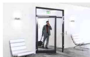
Für den vorbeugenden Brandschutz 12–13