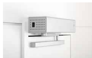
Das modulare System 6–7