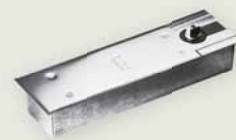
Couverture de haute qualité en VA