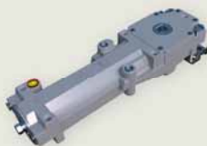
tous les paramètres sont facilement ajustables