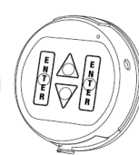
3190 Privat II (optional)