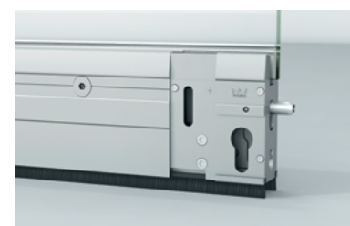
Три варианта запираения в одной системе Multilock

Набор комплектующих EasyKIT представляет собой невероятно простое решение. Готовые наборы компонентов превращает работу с системой HSW EASY Safe в детский конструктор. Использование опциональных модульных элементов обеспечивает простое проектирование и эффективную установку системы HSW EASY Safe. Стандартизация компонентов позволяет значительно сократить время установки. Работу с системой упрощает прямая поддержка со стороны специалистов из подразделений компании DORMA в России и СНГ.