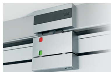
Удобный дисплей с индикатором состояния активной функции панелей

Двойной щёточный уплотнитель верхней и нижней шин успешно борется со сквозняками.