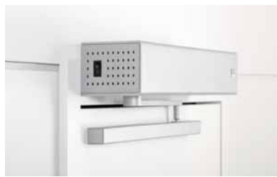
06 Das modulare System