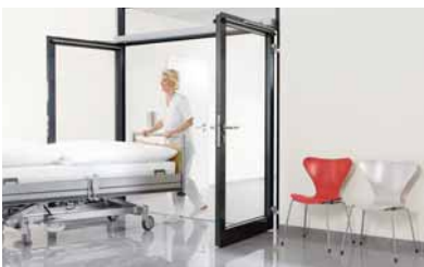
10 Für schnelle Abläufe