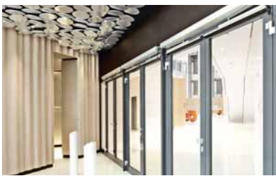
04 ED 100 und ED 250 – Konfigurationen für viele Türsituationen