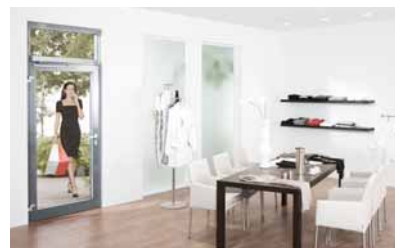
08 Für barrierefreie Zugänge