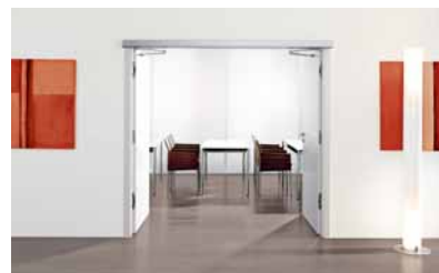
14 Für den kontrollierten Zutritt