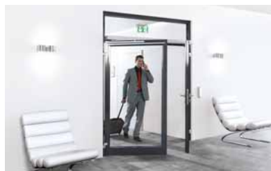
12 Für den vorbeugenden Brandschutz