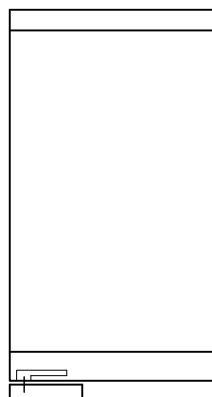
Configuration 5 *

Plinthe basse avec bras en acier, plinthe haute Poids maxi. : 150 kg Largeur maxi. : 1400 mm Hauteur de porte maxi. : 4 m