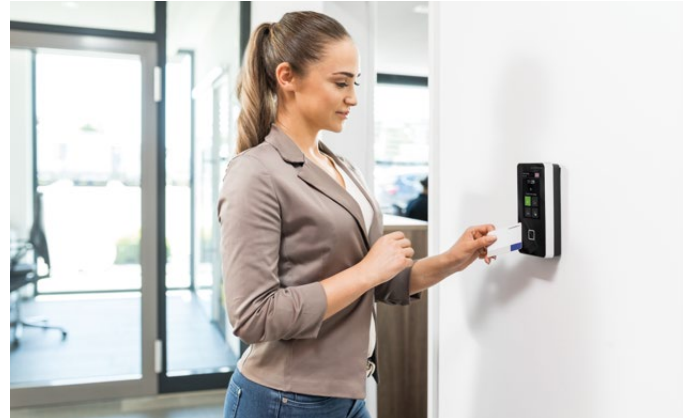
Terminal 96 00 som AoC-station