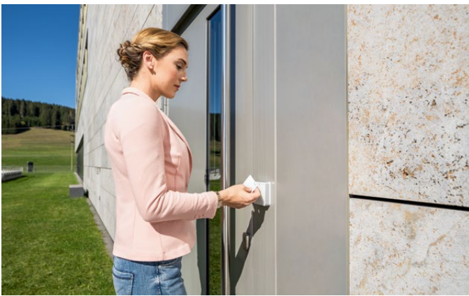
Registreringsenhed 90 02 som AoC-station