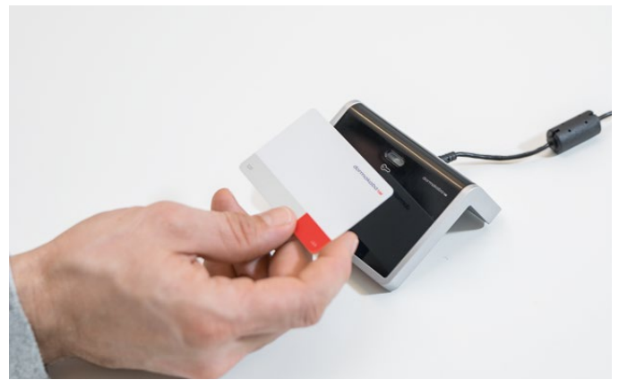
Bordlæser som AoC-station