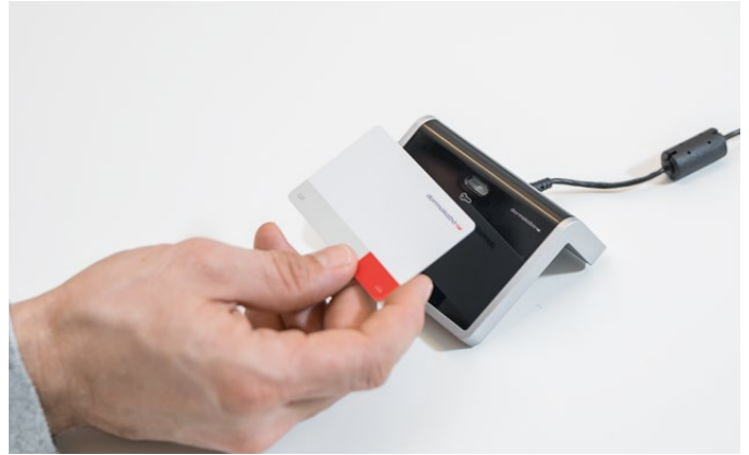
Bordsläsare som AoC-station