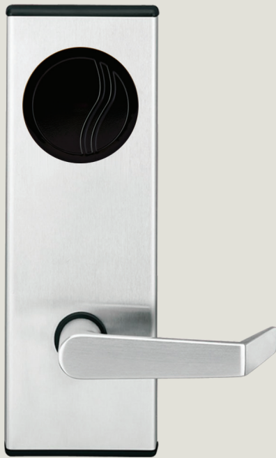
Saflok MT™ RFID