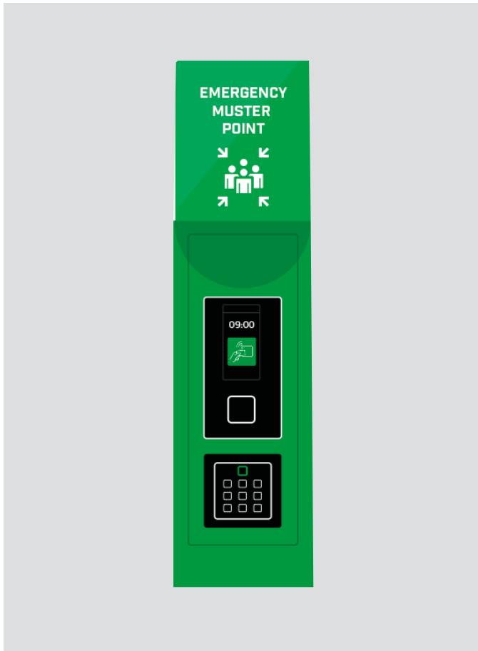
Life-Safety Sammelpunkt Säule