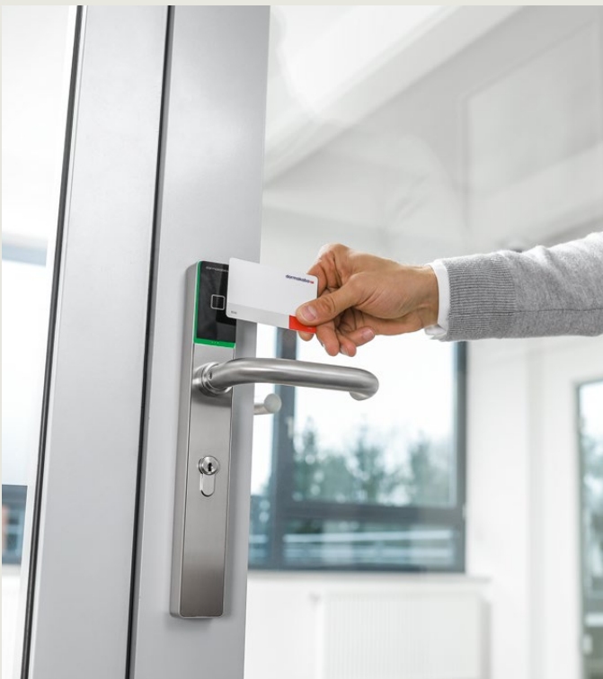
c-lever pro for store eller utvendige dører