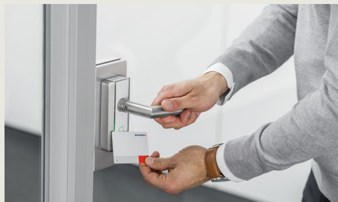
Dette lar de ansatte åpne alle dørene de har autorisasjoner for.