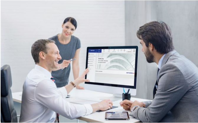
MATRIX som overordnet system