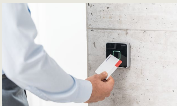
De ansatte kommer til kontoret om morgenen og bruker ID-kortet sitt på den online veggleseren for å åpne døren.