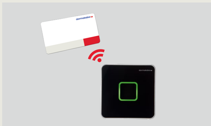
Samtidig lastes de ansattes autorisasjoner for dagen inn på kortet deres.