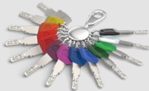
Der Schlüssel mit Largekey-Clip ist ebenfalls in 12 Farben verfügbar.