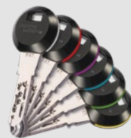
Bei den RFID-Transponder-Clips erleichtern 6 farbige Ringelemente die Orientierung.