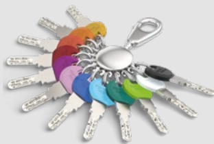
Für den Standardschlüssel gibt es Smartkey-Clips in 12 Farben.