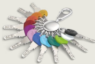
Für den Standardschlüssel gibt es Smartkey-Clips in 12 Farben.