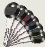
Bei den RFID-Transponder-Clips erleichtern 6 farbige Ringelemente die Orientierung.