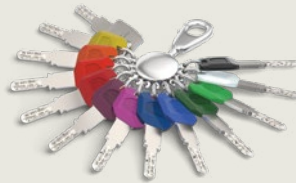
Der Schlüssel mit Largekey-Clip ist ebenfalls in 12 Farben verfügbar.