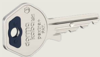
Chiave di secondo livello

Le chiavi di primo livello perdono la loro autorizzazione di chiusura una volta inserite e girate di 360°.