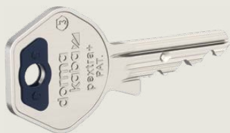
Chiave di terzo livello

Le chiavi di primo livello perdono la loro autorizzazione di chiusura una volta inserite e girate di 360°.