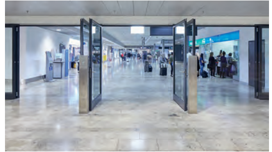
01 2-flügelige Türschliessersysteme

Am Flughafen Zürich kommt der TS 93 z. B. auch im vorbeugenden Brandschutz zum Einsatz. Türen, die bei Normalbetrieb geöffnet sind und den Personenfluss gewährleisten, schliessen im Brandfall, um Feuer und Rauch einzudämmen.