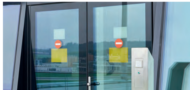
01 Zutrittsleser Zugang zur Zuschauerterrasse Gate B

Die dormakaba Zutrittslösungen für Unternehmen sind modular aufgebaut und passen sich massgeschneidert den neuen Herausforderungen an. Das bedeutet, dass das System mit zukünftigen Bedürfnissen wächst und sich jederzeit erweitern und an neue Begebenheiten anpassen lässt – sowie an die hinzukommenden Anforderungen des neuen attraktiven Zentrums THE CIRCLE.