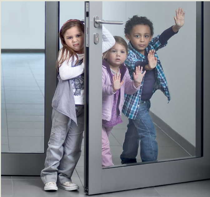
Deuren openen zonder EASY OPEN technologie.