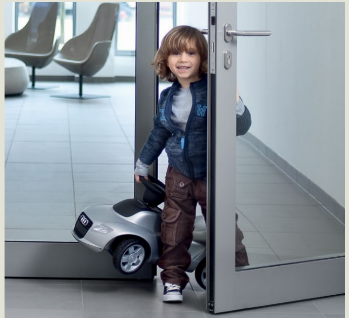
Deuren comfortabel openen met EASY OPEN technologie.