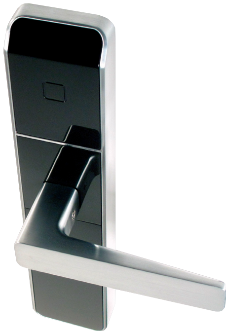
Solamente cárter externo de cerradura